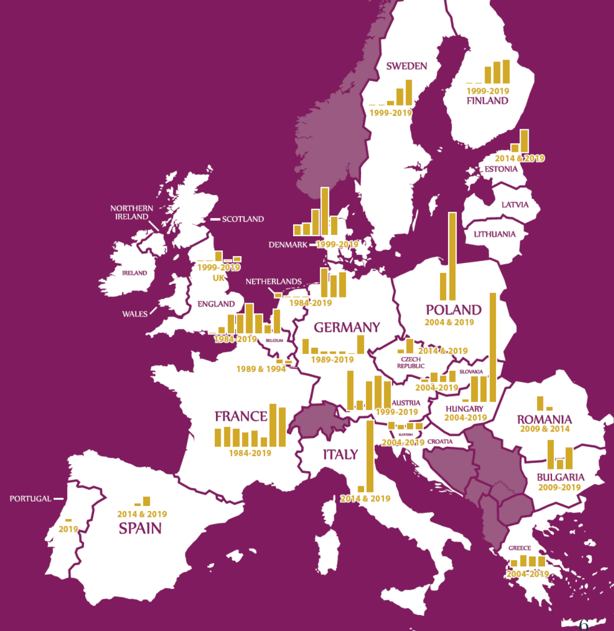
Figure 2: Populist Radical Right Support by EU Country