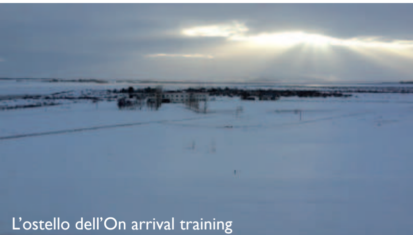
L'ostello dell'On arrival training

priva di stelle e contemporaneamente a darmi il benvenuto in una terra che da sempre ha rappresentato il mio sogno più grande....” Il resto del report sul nostro sito sezione “Servizio Volontario Europeo” ( www.retecivica.trieste.it/eud/default.asp?tabella_padre=sezioni&ids=12&tipo=-&pagina=vis_esperienzavita_esamina.asp&idesperienza=149 )