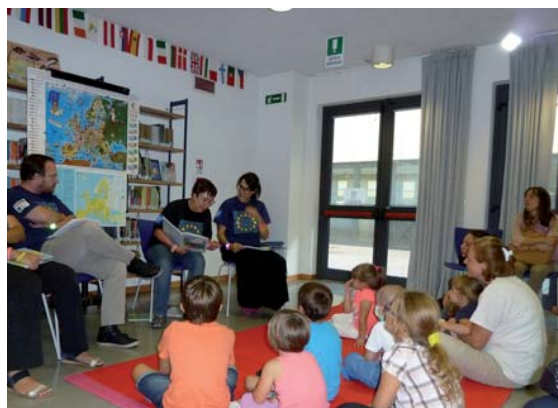
Una foto dell'evento organizzato nel 2015

Come gli anni scorsi, il nostro ufficio festeggerà tale giornata assieme alla Biblioteca Quarantotti Gambini di Trieste con l'incontro "Un mondo di storie dall'Europa" durante il quale si leggeranno alcune fiabe in 5 lingue europee...quali? Sorpresa!