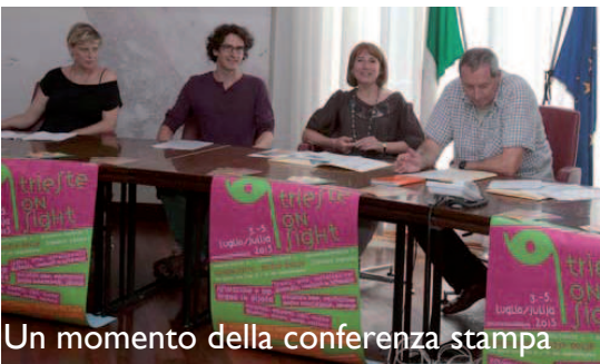
Un momento della conferenza stampa